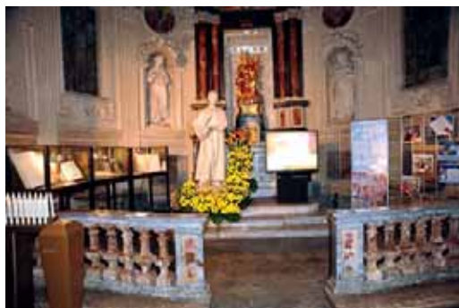
Parte de la muestra sobre Miguel Magone y Don Bosco en la iglesia parroquial del joven