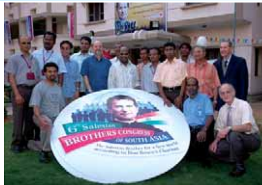
Pocos de los 118 coadjutores SDB que participaron del congreso sudasiático a fines del año pasado. La región Asia Sur incluye India, Nepal, y Sri Lanka.

El coadjutor SDB es una “vocación original,” el Hno. Marangio dijo, “porque representaba un estilo de vida religiosa moderno y original, en el cual la