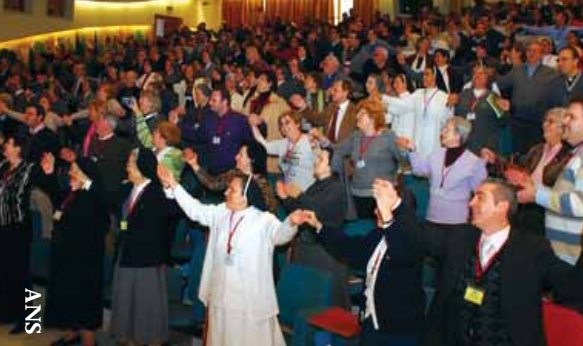
Jornadas de Espiritualidad en función

Para estos dos encuentros, el Aguinaldo de 2009 supo ser una fuente de bienvenida y de reunión para lograr una eficacia más grande para llevar la misión salesiana en el norte como en el sur de la Inspectoría Oriental. Estos encuentros suministran muchas maneras un sentido de “regreso a la casa” para los miembros de la FS que participan en ellos. Pero más importante aún, le están un momento de “envío” también.