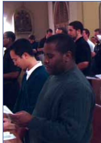
Salesianos jóvenes y muchachos en oración en la casa salesiana de St. Paul.

1. Económico. Los graduados del “college” a menudo tienen préstamos muy altos que deben reembolsar. Los Salesianos no aceptan candidatos que tengan