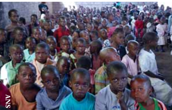
Niños refugiados en el Centro Don Bosco de Goma, Congo