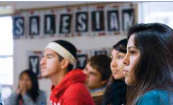
Participantes en la Cumbre escuchan atentamente una de las presentaciones.

de las estaciones diferentes y confusas para poder obtener sus papeles, encontrar alimento y albergue, y poder ser admitidos en un lugar de refugio. Tuvieron que soportar todo esto bajo la vigilancia de la patrulla de fronteras y los sonidos de la guerra. A algunos miembros de la familia se les pidió que fingieran un trauma o la muerte. Aunque para los participantes se trataba de un juego, la experiencia mostró claramente el peregrinar heroico y arduo de tantas personas para llegar a la libertad deseada, algo que los que la disfrutan dan por sentado.