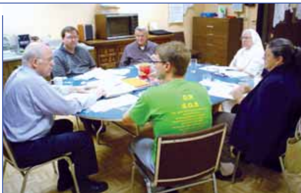
La Consulta Familia Salesiana de la inspectoría de New Rochelle en una reunión en 2008

• Un instrumento de comunión: la consulta local e inspectorial de la FS. Dar mayor consistencia a la consulta local e inspectorial de la FS, buscando la forma más adecuada para realizarla, para que no sea sólo una ocasión de intercambio de ideas y experiencias, sino sobre todo un instrumento (1) para reflexionar juntos sobre los desafíos de la misión en el propio territorio y para compartir algunas líneas fundamentales de respuesta que cada grupo se esfuerza por asumir; (2) para buscar caminos de colaboración ágil y bien articulada en proyectos educativos y de evangelización, sobre todo al servicio de los jóvenes.