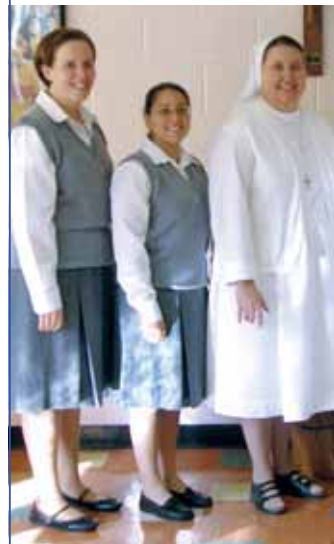
Cuatro novicias FMA con las inspectoras (centro izquierda) y la Hna. Santa en su noviciado en Newton, N.J., en agosto.