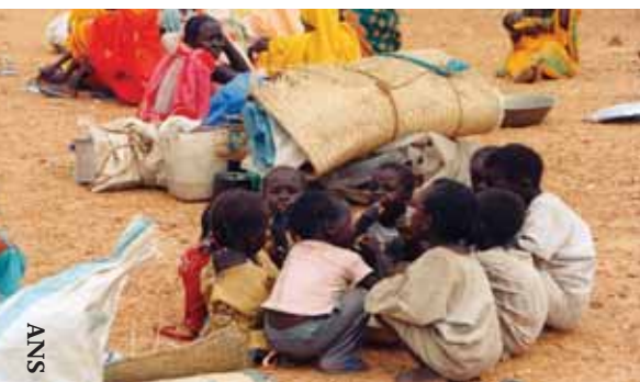
Los niños en un campamento de refugiados en Darfur en 2004. Los Salesianos han llevado algunos jóvenes al Don Bosco Centro Técnico en El Obeid para su seguridad e su educación.

Ahora, nuestra meta es expresar la comunión en la misión, teniendo presentes: (1) las constantes de los orígenes y del desarrollo de la FS; (2) las condiciones del mundo de hoy . La FS tratará juntamente de dar espesor a la propia presencia: hay el problema juvenil, la vida, la pobreza, la paz, los derechos humanos, hay Jesús que hacer conocer; (3) los últimos aguinaldos : han puesto en evidencia la educación, la familia, la promoción de la vida, la preferencia por los pobres, la solidaridad globalizada, la nueva.