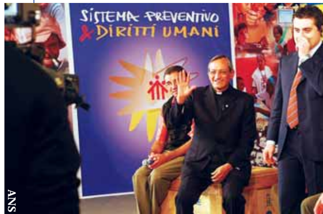
El Rector Mayor en una entrevista que concedió a la RAI, la red de televisión nacional italiana, durante el Congreso de los Derechos Humanos

Al final del Congreso, la asamblea había redactado 30 propuestas y un mensaje para el mundo salesiano. El centro del mensaje: “Como Familia Salesiana, renovamos nuestro compromiso educativo para trabajar por la promoción y la protección de los derechos humanos, por la formación integral de los jóvenes, especialmente los más pobres, y por la construcción de una sociedad que sea más justa y