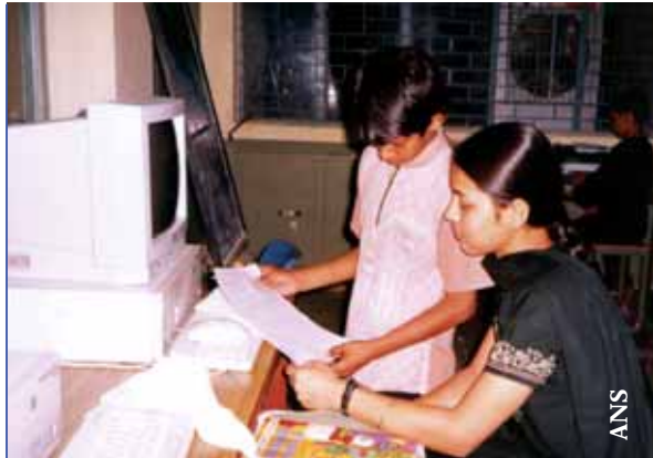
Una voluntaria enseña a una joven a usar un computadora en el centro Don Bosco Asbalayam de Nueva Delhi.