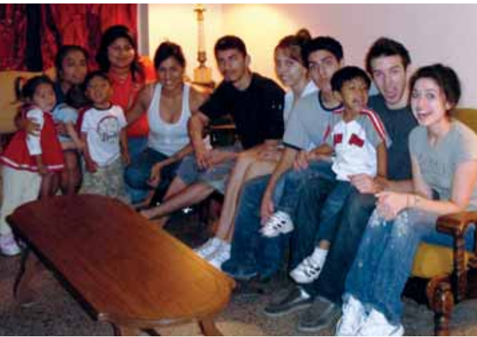
Jóvenes californianos con la familia que los recibió, después de limpiar y arreglar la casa.