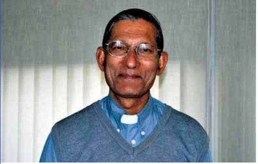
P. Joseph D'Souza

The Disciples, o Instituto Secular Don Bosco, es una asociación pública eclesial masculina y femenina nacida en la India en 1973 por el P. Joseph D'Souza, SDB. Inspirados en el pasaje evangélico de la misión que Jesús confía a los 72 discípulos, proclaman el Evangelio, enseñan el catecismo, cuidan de los enfermos, y sirven a los pobres. Hoy son más de 400 en 44 diócesis de la India y 6 de Italia.